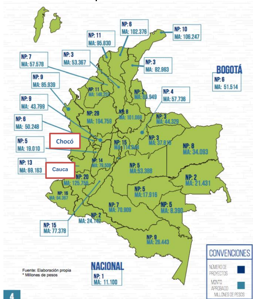
Imagen 1. Número de proyectos y recursos aprobados del FCTI por departamento 2012-2015

Fuente: Observatorio Colombiano de Ciencia y Tecnología. Sitio web: http://investigacion.unal.edu.co/fileadmin/recursos/siun/docs/comites/nac-investigacion/2017/04/acta-3-cni-20170918-anexo2.pdf