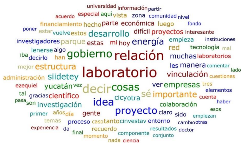
Figura 2. Nube de palabras de una entrevista