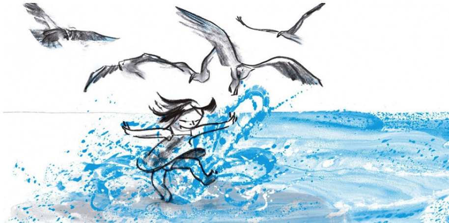
Figura 1. La ola (2008)

Evidentemente, otro factor que guiará nuestra elección será, en esta etapa, el impacto del componente visual del libro, ya que en esta fase prelectora el primer mensaje se vehiculará de esta forma. En este sentido, La ola de Suzy Lee ( Figura 1 ) es un óptimo ejemplo: un libro sin palabras, protagonistas una niña y el mar, que ganó el Primer Premio al Mejor Libro Ilustrado en 2009, otorgado por el Gremio de Libreros de Madrid.