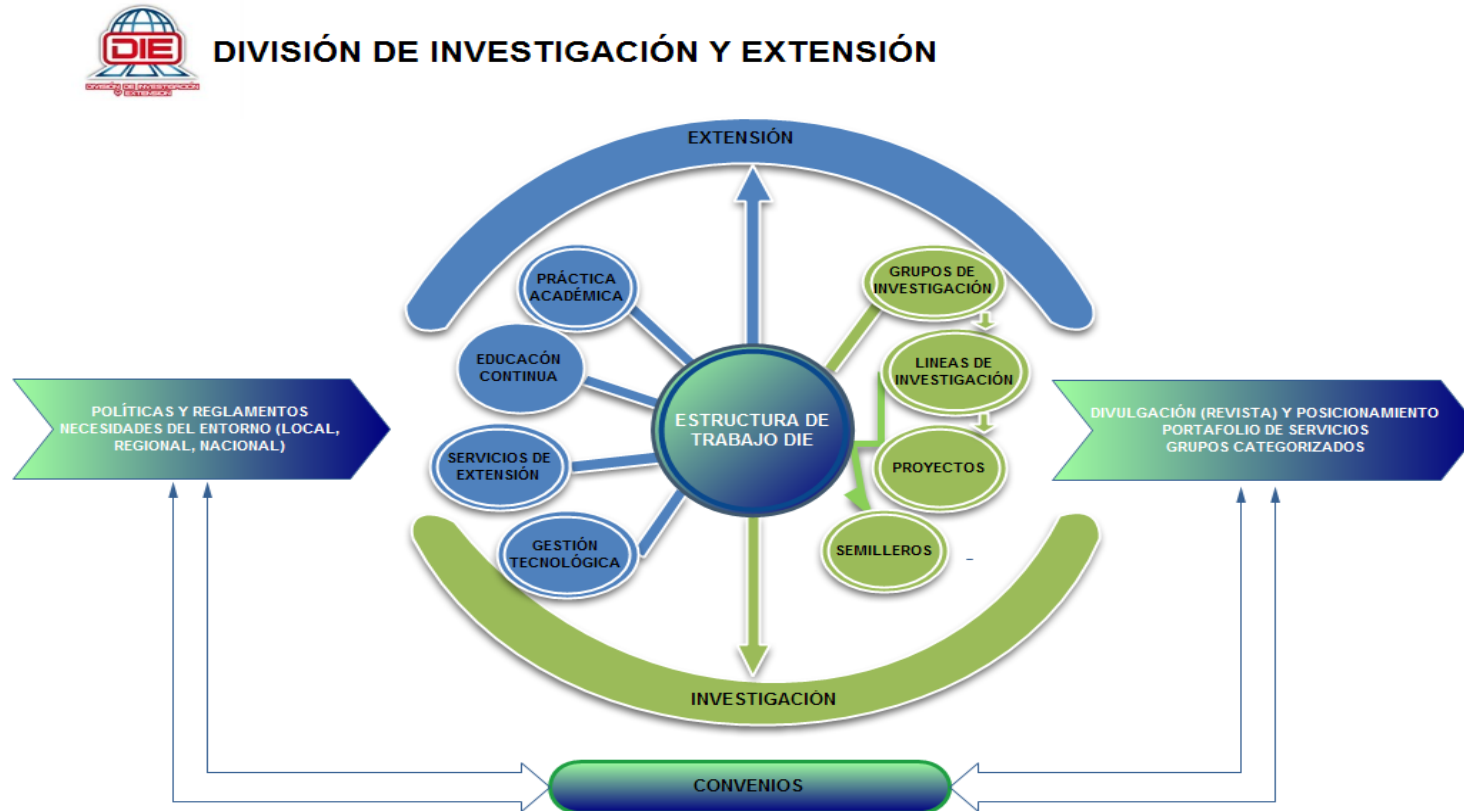
Gráfico 2. Estructura de trabajo de la división de investigación y extensión (DIE) de la UFPSO