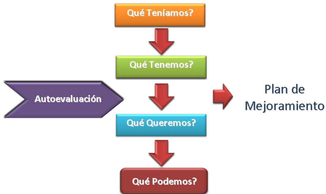
Gráfico 1. Paradigma institucional de autoevaluación